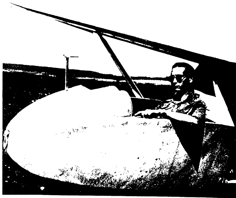
Autor na GB ve Zbraslavicích 1947.