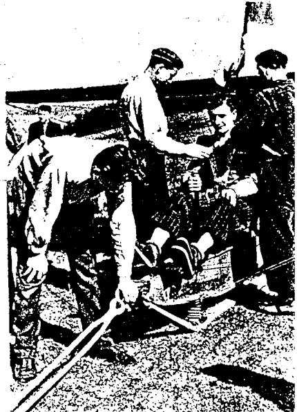
Výcvik na "Vinici" v celostátním kalendáři 1947.